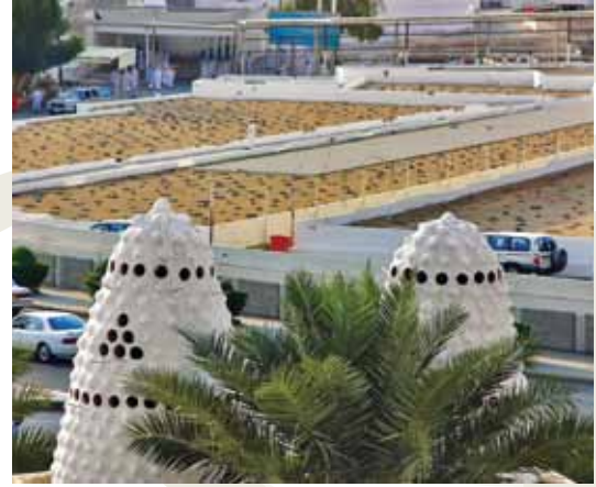
Cennetü'l-Mualla / Mekke