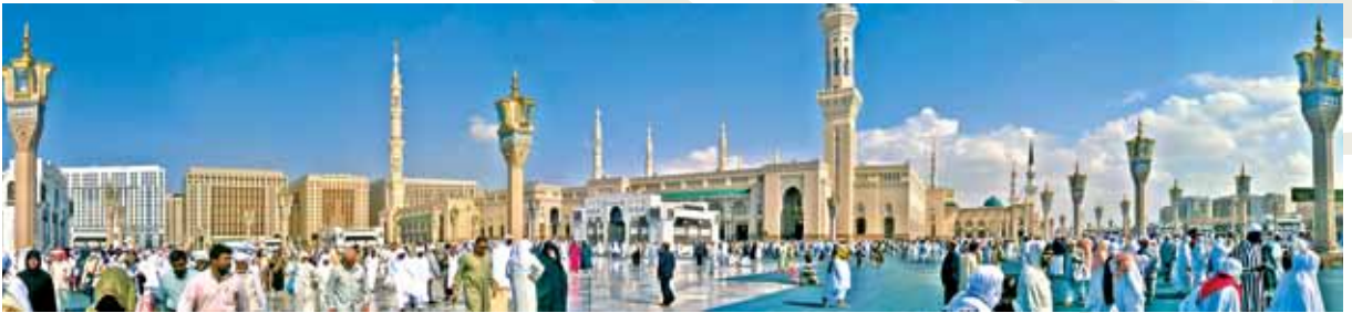
Mescid-i Nebi / Medine