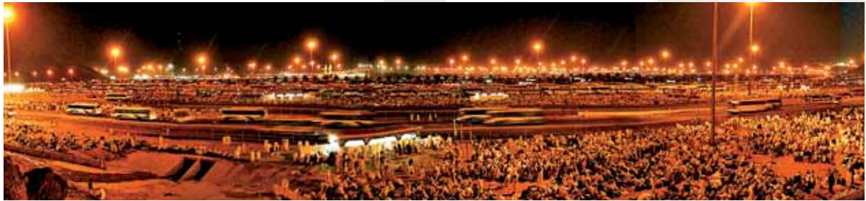
Müzdelife / Mekke