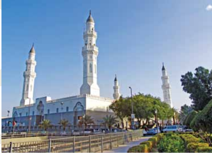
Kuba Mescidi / Medine

Mekke'de; Harem avlusuna uzaklığı 3500 m. mesafe içerisinde olan, Medine'de; Merkeziye'de, Mescid-i Nebi'ye yürüme mesafesinde yer alan binalarda sağlanacaktır.