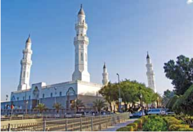
Kuba Mescidi / Medine