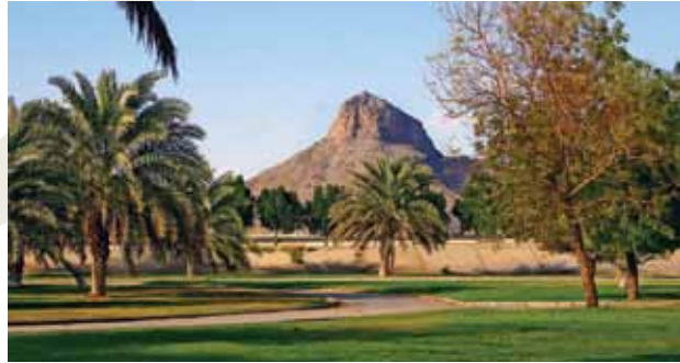
Hira Dağı / Mekke