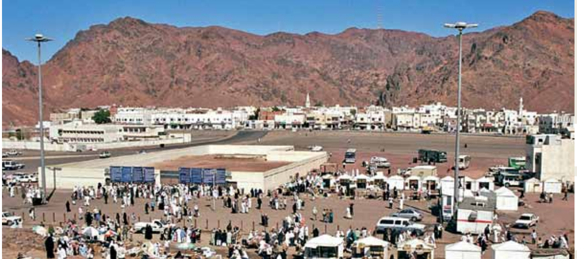
Uhut Şehitliği / Medine

Mekke'de; Harem avlusuna uzaklığı 7000 m. mesafe içerisinde olan, Medine'de; Merkeziye'de, Mescid-i Nebi'ye yürüme mesafesinde yer alan binalarda sağlanacaktır.