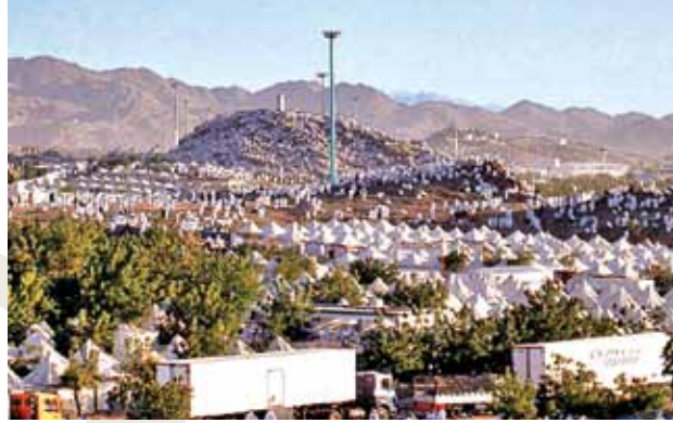
Arafat Dağı - Cebel-i Rahme / Mekke