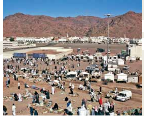
Uhud Şehitliği / Medine