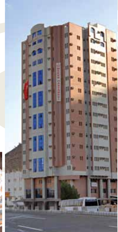
Mekke Diyanet Hastanesi