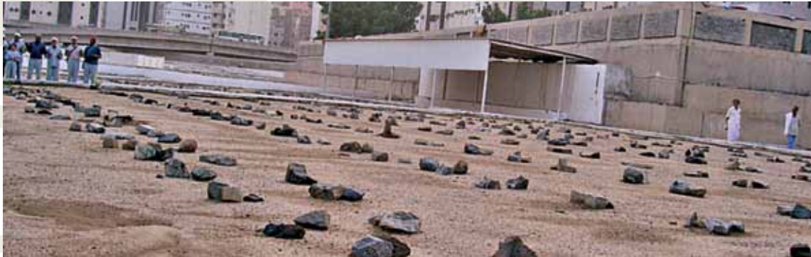
Cennetü'l-Mualla / Mekke

Mekke'de; Harem avlusuna 300-350 m. mesafedeki Ecyad , Medine'de; Merkezi'de, Harem'e çok yakın mesafede yer alan Hilton veya Obray otelinde sağlanacaktır.