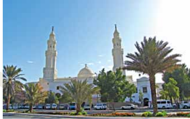
Kibleteyn Mescidi / Medine