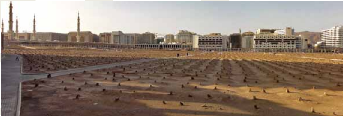
Cennet-ül Baki / Medine

Mekke'de; Harem avlusuna bitişik olan Hilton , Medine'de; Merkezi'de, Harem avlusuna bitişik olan Obray otelinde sağlanacaktır.