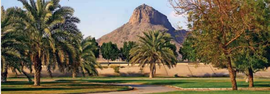
Hira Dağı / Mekke

Mekke'de; Harem'e yürüme mesafesi içerisinde yer alan Mercuri, Medine'de; Merkeziye'de, Harisiye otelinde sağlanacaktır.