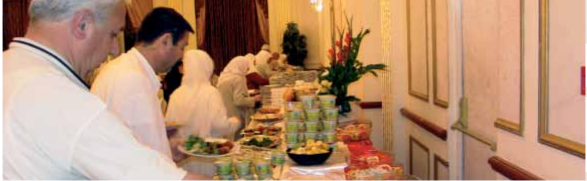
Açık büfe yemek hizmeti

Mekke'de; Harem avlusuna bitişik olan Mövenpick , Medine'de; Merkeziye'de, Harem'e çok yakın mesafede yer alan Hilton veya Obray otelinde sağlanacaktır.