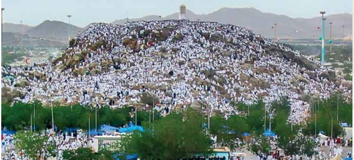
Arafat Dağı - Cebel-i Rahme

Mekke'de; Harem avlusuna uzaklığı 1500 m. mesafe içerisinde olan, Medine'de; Merkeziye'de, Mescid-i Nebi'ye yürüme mesafesinde yer alan binalarda sağlanacaktır.