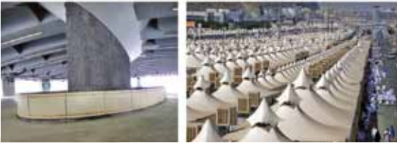
Şeytan Taşlama / Mina-Mekke