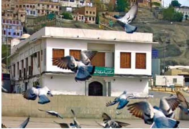
Peygamberimizin Doğduğu Ev / Mekke