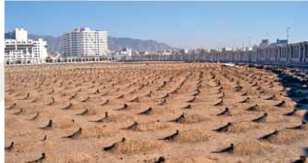
Cennetü'l-Baki / Medine