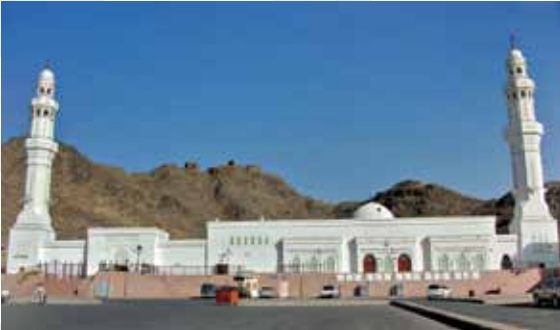
Mesacid-i Seb'a / Medine